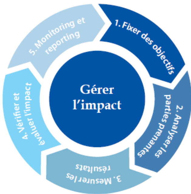
La chaîne de valeur de l'impact